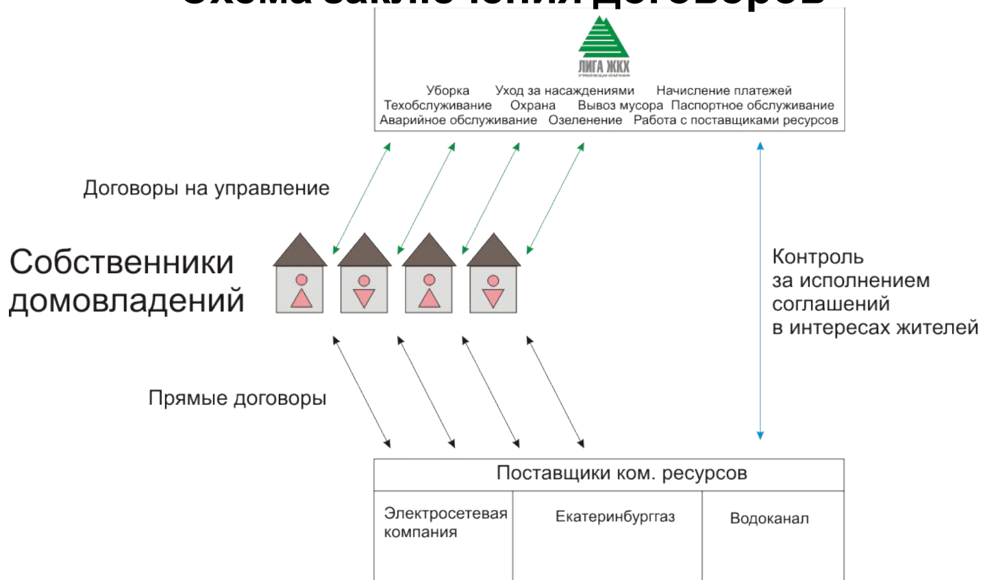
Схема заключения договоров