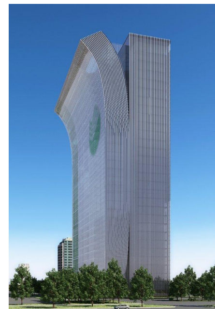
Многофункциональный сервисный центр