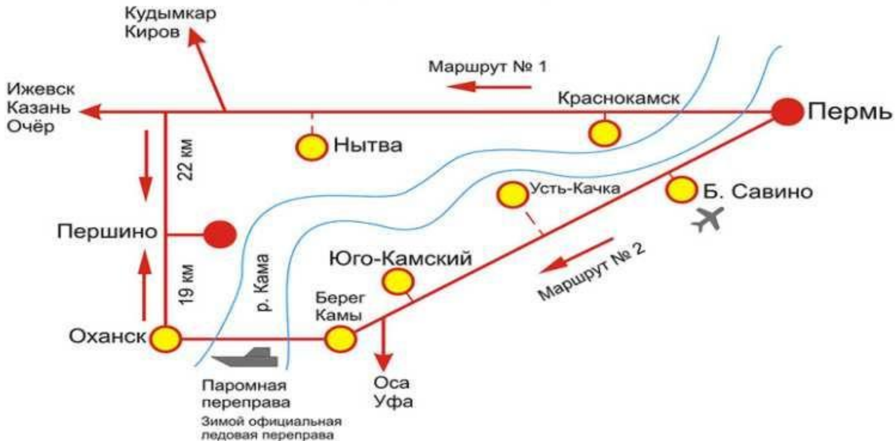
СХЕМА проезда до базы «Першино»