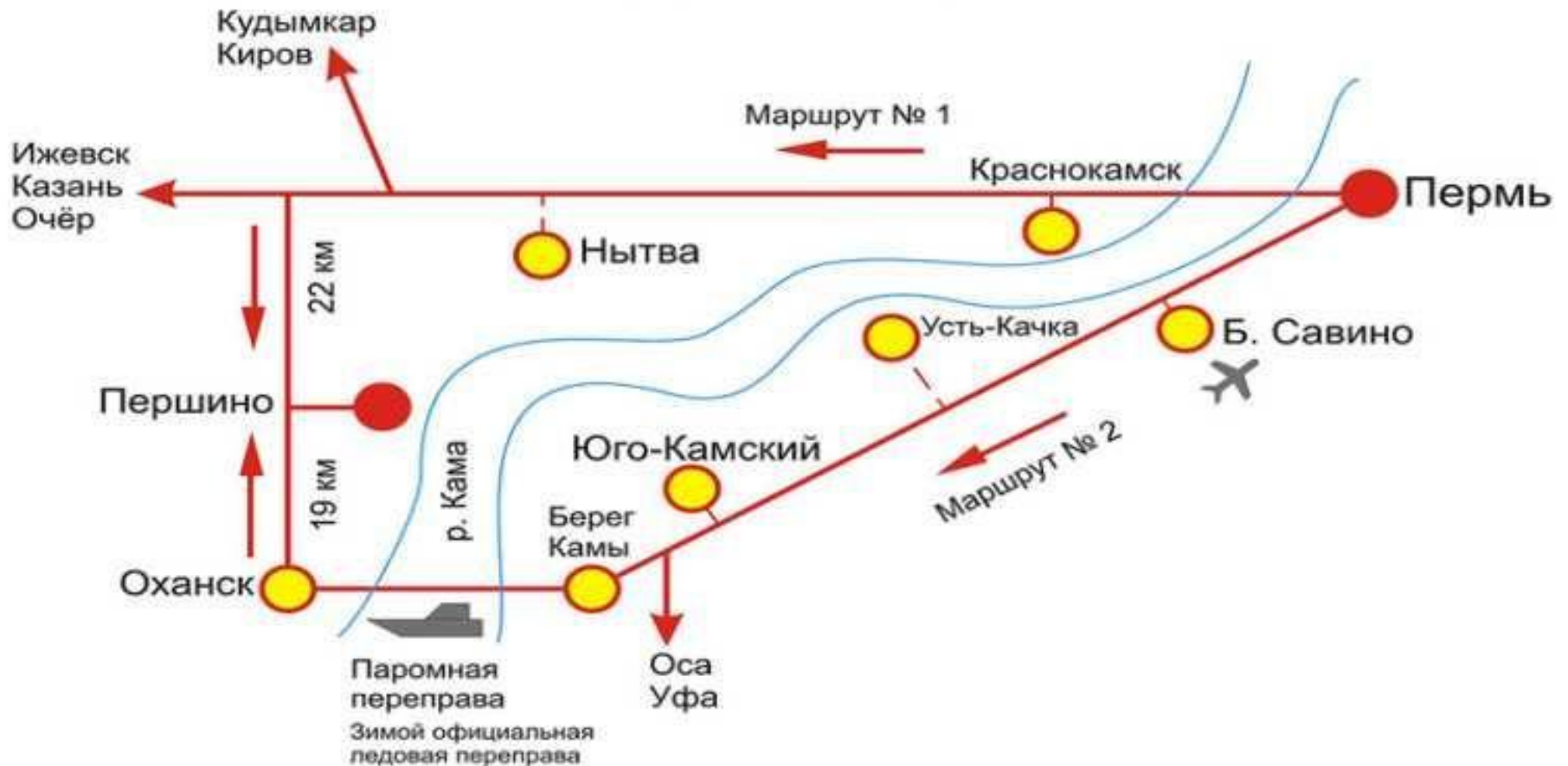
СХЕМА проезда до базы «Першино»