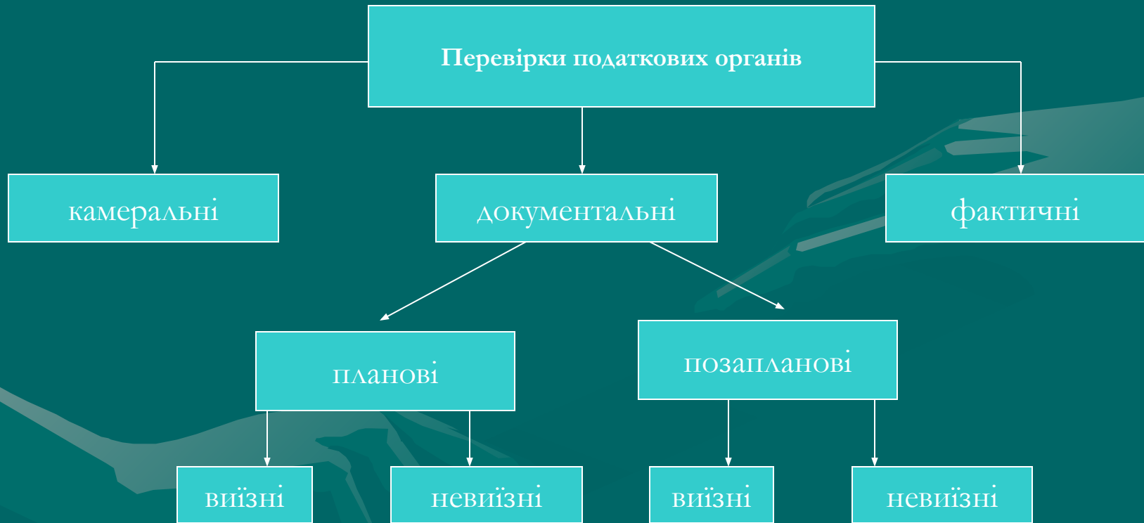
Рис. 3. Види перевірок згідно Податкового кодексу