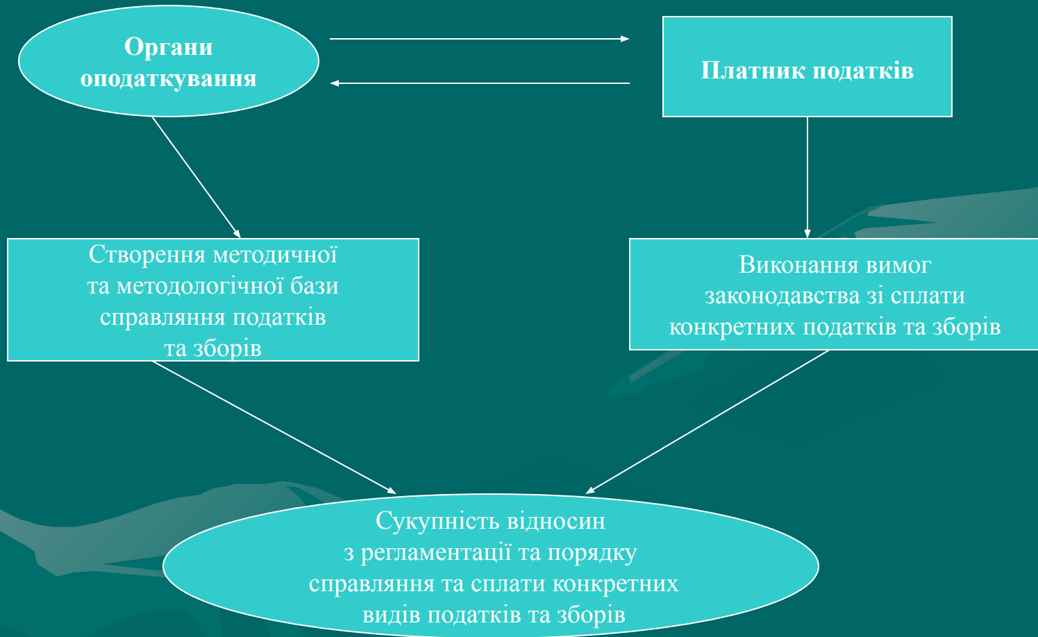
Рис. 1. Механізм адміністрування податків