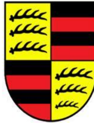
Coat of arms of state of Württemberg-Hohenzollern 1945-1952