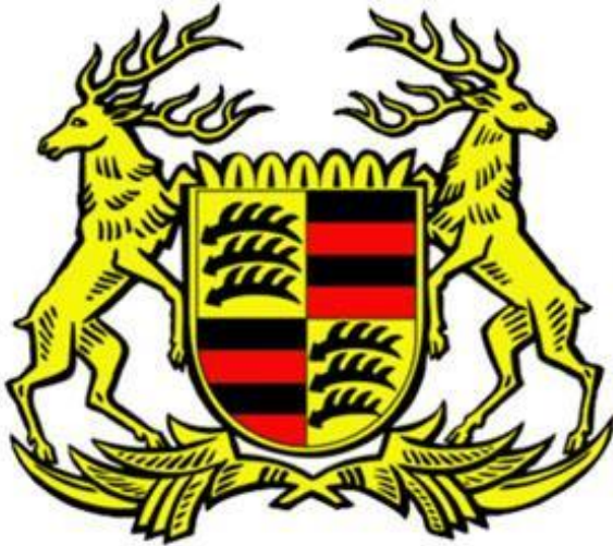
Coat of arms of Free People's State of Württemberg 1922-1945