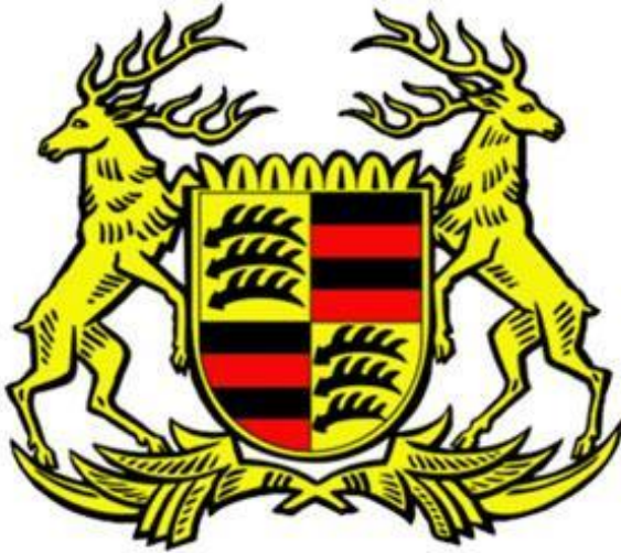
Coat of arms of Free People's State of Württemberg 1922-1945