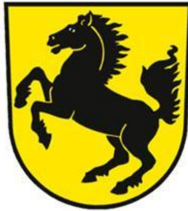
Coat of arms of Stuttgart as of 1938