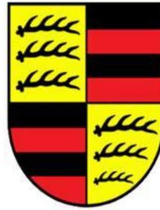
Coat of arms of state of Württemberg-Hohenzollern 1945-1952