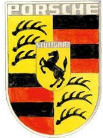
Original sketch of Porsche crest by Franz Zaver Reimspess 1952