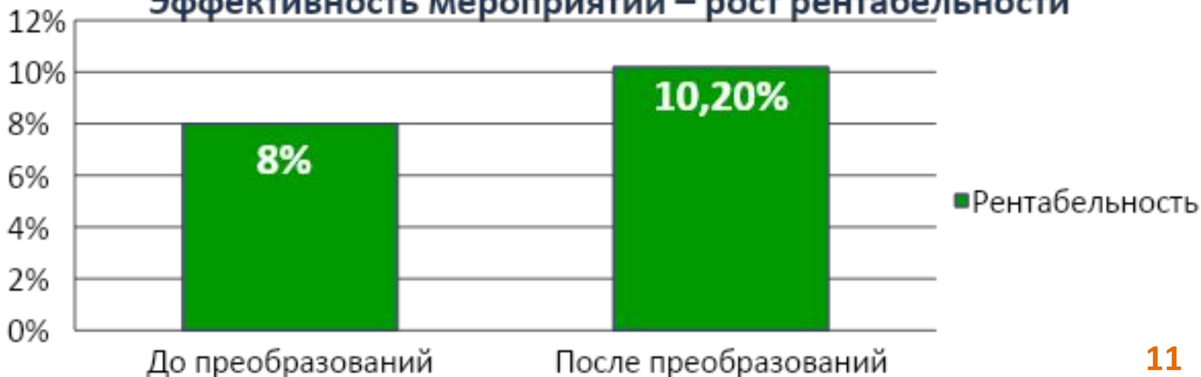
Эффективность мероприятий – рост рентабельности