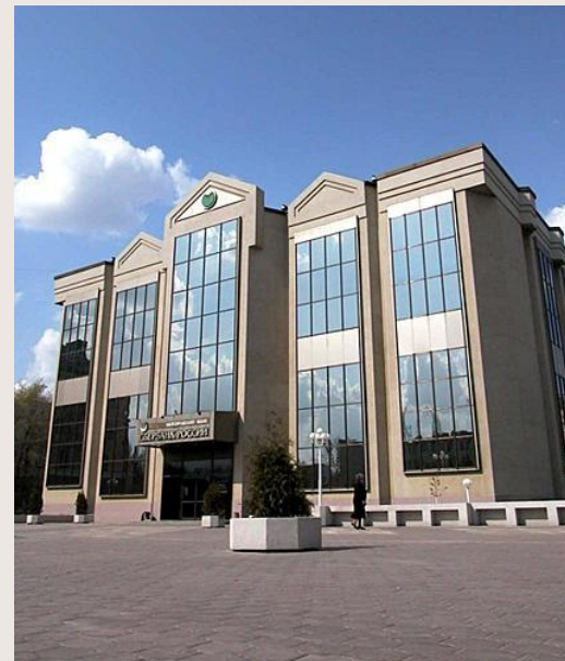
Сберегательный банк России город Белгород