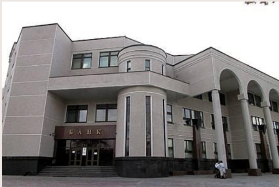
Промстройбанк город Белгород