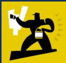
работа и услуги

то, на что направлена деятельность участников правоотношения