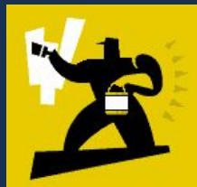
работа и услуги

то, на что направлена деятельность участников правоотношения