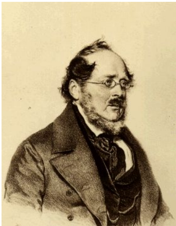
Friedrich List (1789–1846)

Начало новой научной дисциплины – экономической истории было положено в 1850-1870 гг. в рамках прежде всего немецкой старой исторической школы политэкономии