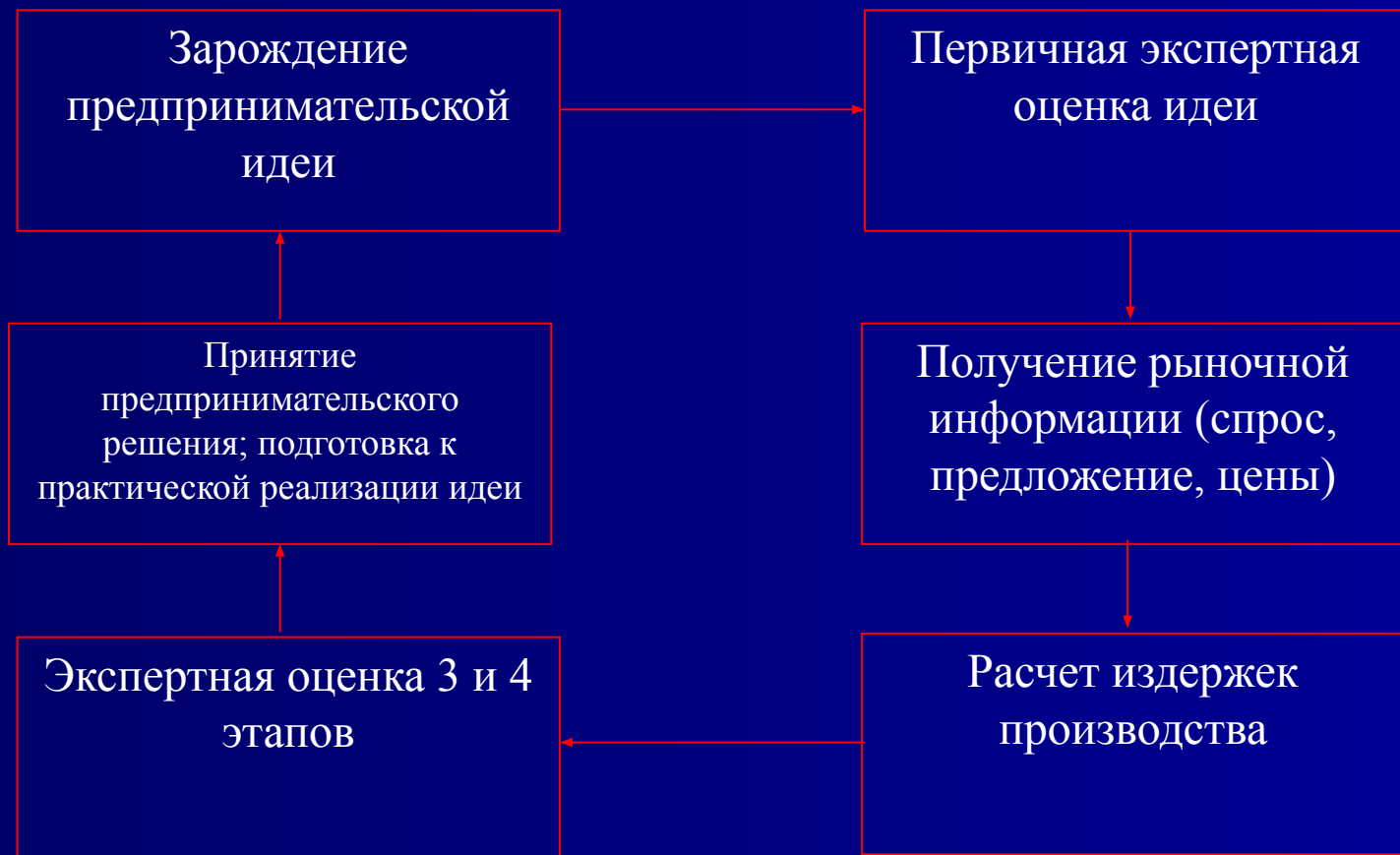
СХЕМА ПРЕДПРИНИМАТЕЛЬСКИХ ДЕЙСТВИЙ