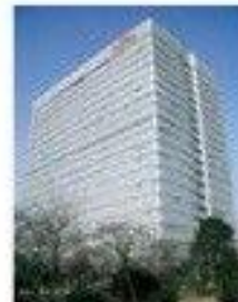
8 Fujitsu Limited (Kawasaki)