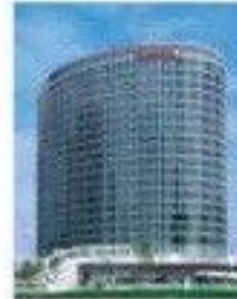
6 Fuji Xerox Co., Ltd. (Yokohama)