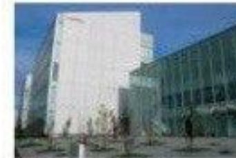
10 Ajinomoto Co., Inc. (Kawasaki)