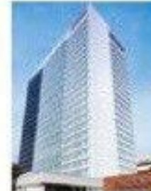
7 Ricoh Company, Ltd. (Ebina)