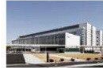
9 Takeda Pharmaceutical Company Limited (Fujisawa and Kamakura)