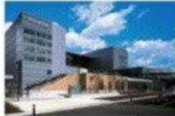
3 Fujifilm Corporation (Kaisei-machi)