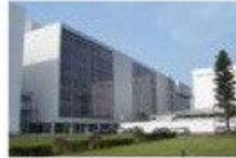
5 Sony Corporation (Atsugi)