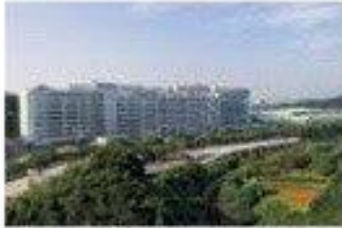
1 Nissan Motor Co., Ltd. (Atsugi)

Bosch Corporation (Yokohama) Daimler AG (Kawasaki) Isuzu Motors Limited (Fujisawa) NHK Spring Co., Ltd. (Yokohama) Mitsubishi Fuso Truck and Bus Corporation (Kawasaki) The Yokohama Rubber Company, Limited (Hiratsuka) Ichikoh Industries, Ltd. (Isehara) Yorozu Corporation (Yokohama) Continental Automotive Corporation (Yokohama)