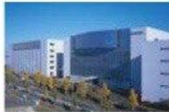
4 Ulvac, Inc. (Chigasaki)