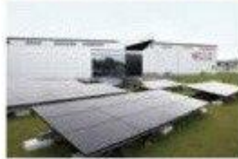
2 Showa Shell Sekiyu K. K. (Atsugi)