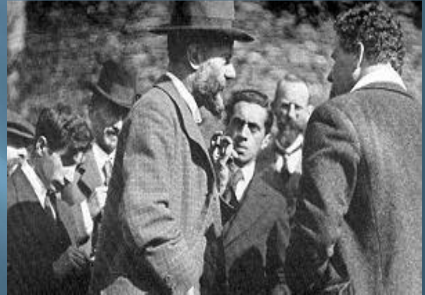
Макс Вебер среди своих студентов, 1917 год.

Протестантская этика и дух капитализма, первое издание