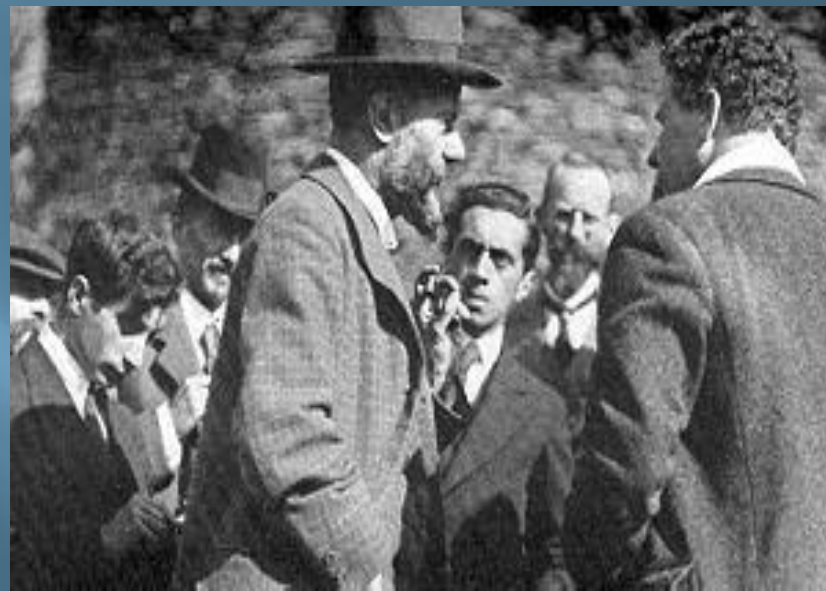
Макс Вебер среди своих студентов, 1917 год.

Протестантская этика и дух капитализма, первое издание