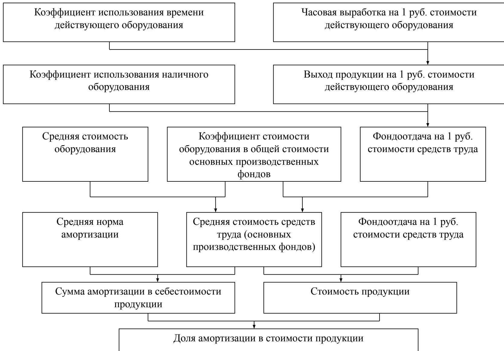
Схема формирования и анализа показателей и факторов использования средств труда