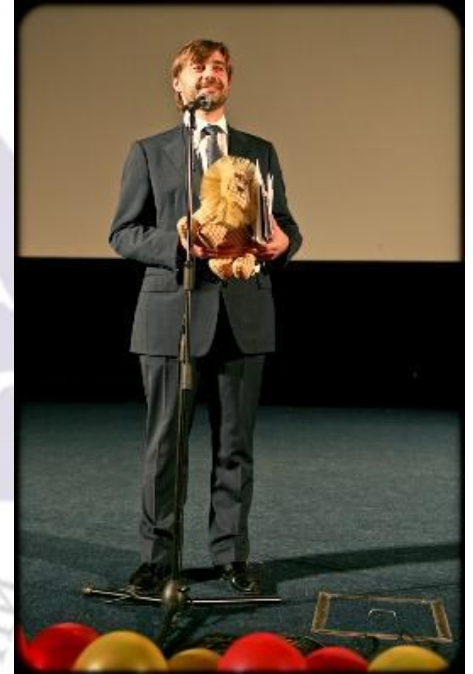
Почетный гость Презентации 2009 г Железняк С.В. (депутат Государственной Думы)