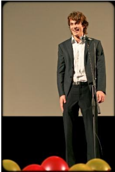
Гость Презентации 2009 г. Москва – актер Василий Степанов («Итаемый Остров»)