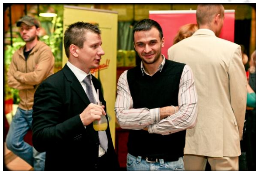
Гость Презентации 2009 г. Игорь Верник (телеведущий)