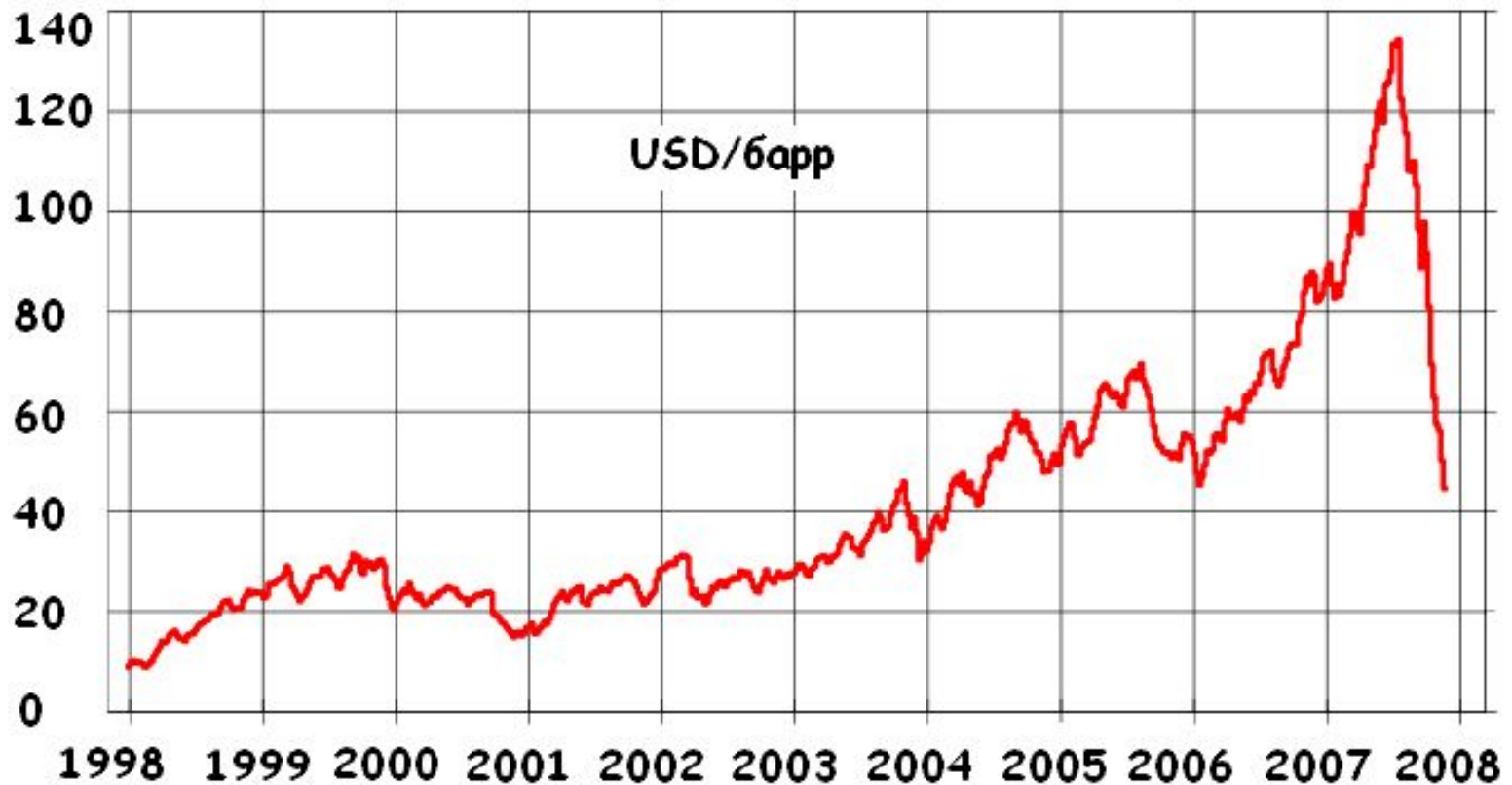
Динамика изменения стоимости нефти