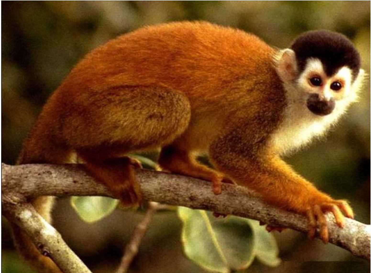
беличья обезьяна (саймири)