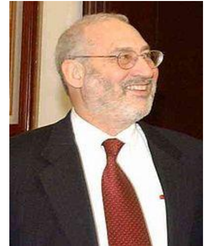
Джозеф Юджин Стиглиц 1943г.

Американский финансист, инвестор и филантроп. Написал работу «Тезисы о глобализации», где указал о проблеме мирового капитала и налогообложения.