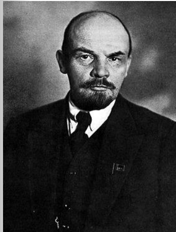
В.И. Ленин (1824-1870гг)

российский и советский политический и государственный деятель. Написал работу "Империализм как высшая стадия капитализма" в ней даны основные определения и характеристики системы мирового капитализма.