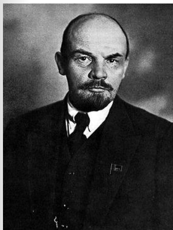
В.И. Ленин (1824-1870гг)

российский и советский политический и государственный деятель. Написал работу "Империализм как высшая стадия капитализма" в ней даны основные определения и характеристики системы мирового капитализма.