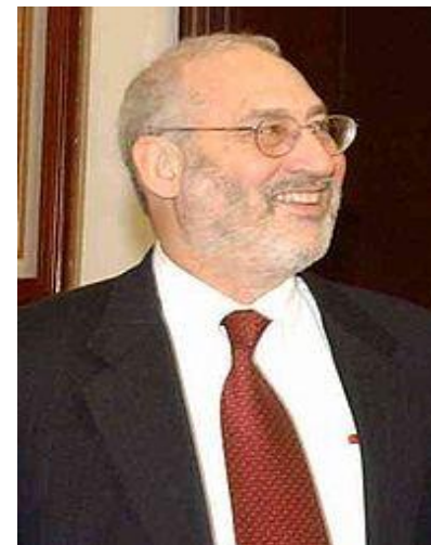
Джозеф Юджин Стиглиц 1943г.

Американский финансист, инвестор и филантроп. Написал работу «Тезисы о глобализации», где указал о проблеме мирового капитала и налогообложения.