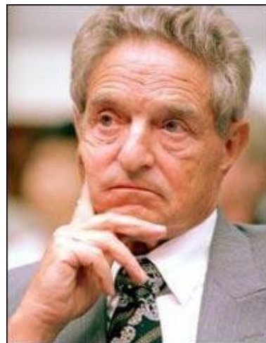
ДЖОРДЖ СОРОС 1930г.

российский и советский политический и государственный деятель. Написал работу "Империализм как высшая стадия капитализма" в ней даны основные определения и характеристики системы мирового капитализма.