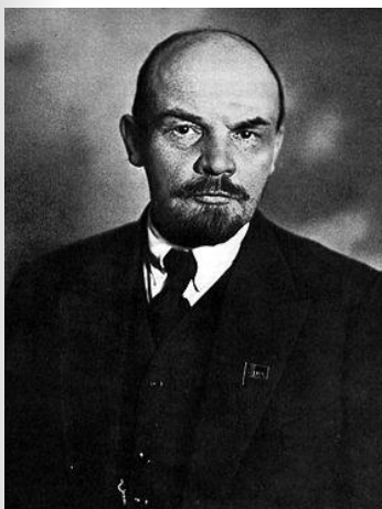
В.И. Ленин (1870-1924гг)

русский и советский политический и государственный деятель. Написал работу "Империализм как высшая стадия капитализма" в ней даны основные определения и характеристики системы мирового капитализма.