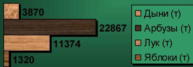
Статистика товарооборота за 1997 год