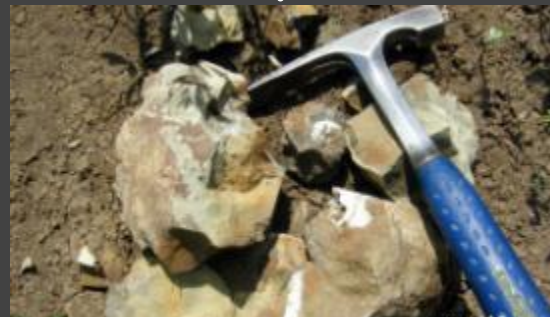
Открытие месторождений полезных ископаемых