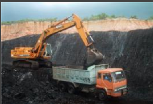
Добыча полезных ископаемых