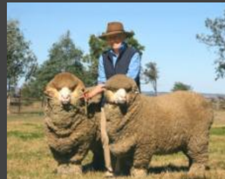
Выращивание овец- мериносов