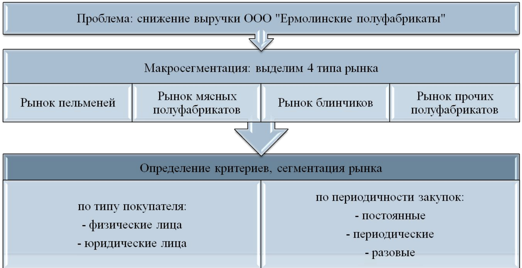
Рисунок 3 – Сегментация покупателей ООО «Ермолинские полуфабрикаты»