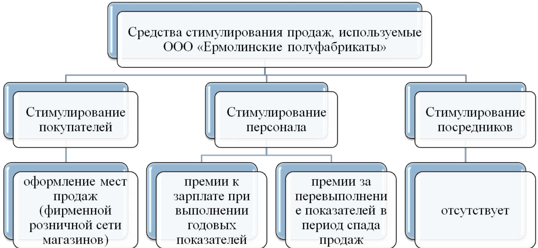
Рисунок 5 - Средства стимулирования продаж предприятия