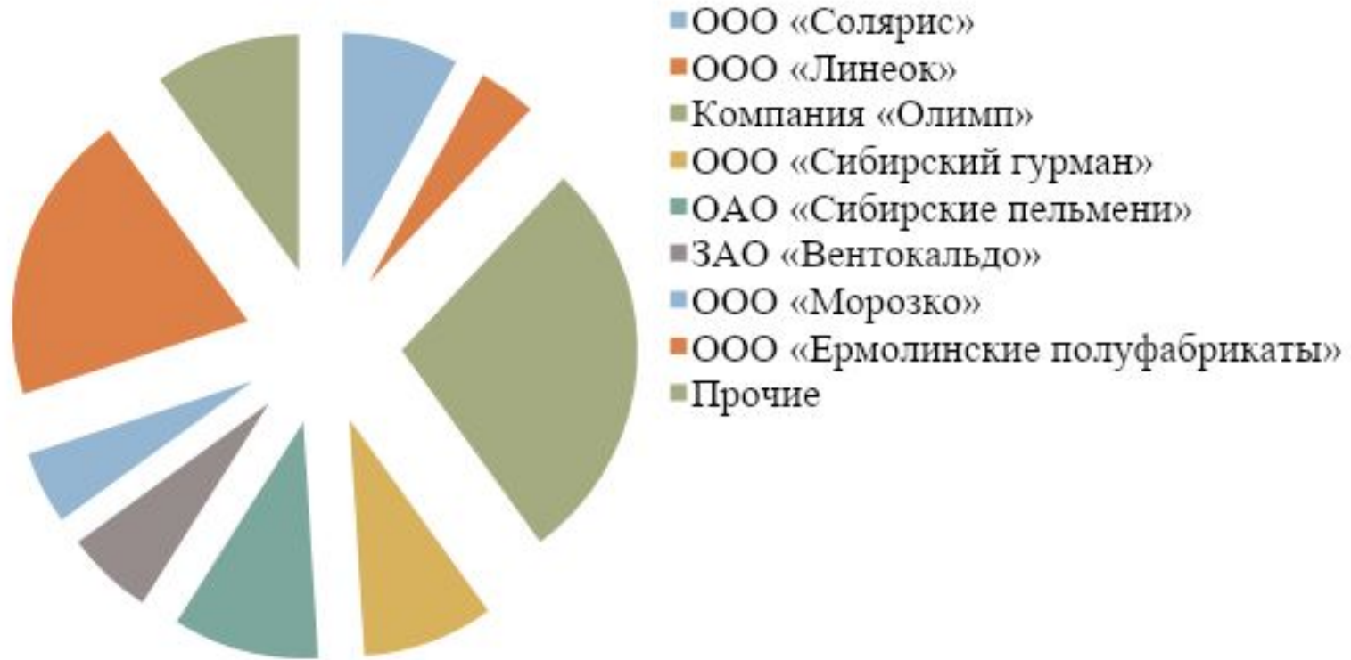
Рисунок 1 – Структура рынка замороженных полуфабрикатов в г.Красноярске