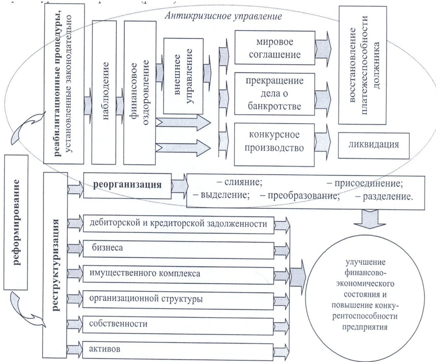
Схема взаимосвязи понятий «реформирование», «реструктуризация», «реорганизация» и «реабилитация»