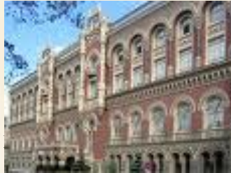
Рис. Национальный банк (г. Киев)

Центральный банк выделился из коммерческих банков еще в 18-19 в. Центральному банку государство представило исключительное право эмиссии банкнот. Некоторые из Централных банков были сразу учреждены как государственные институты (Немецкий федеральный банк, Резервный банк Австралии), другие были национализированы после Второй мировой войны (Банк Франции, Англии, Японии, Канады, Нидерландов). Некоторые Центральные Банки до сих пор существуют на основе смешанной государственно-частной собственности (Федеральная Резервная Система США).