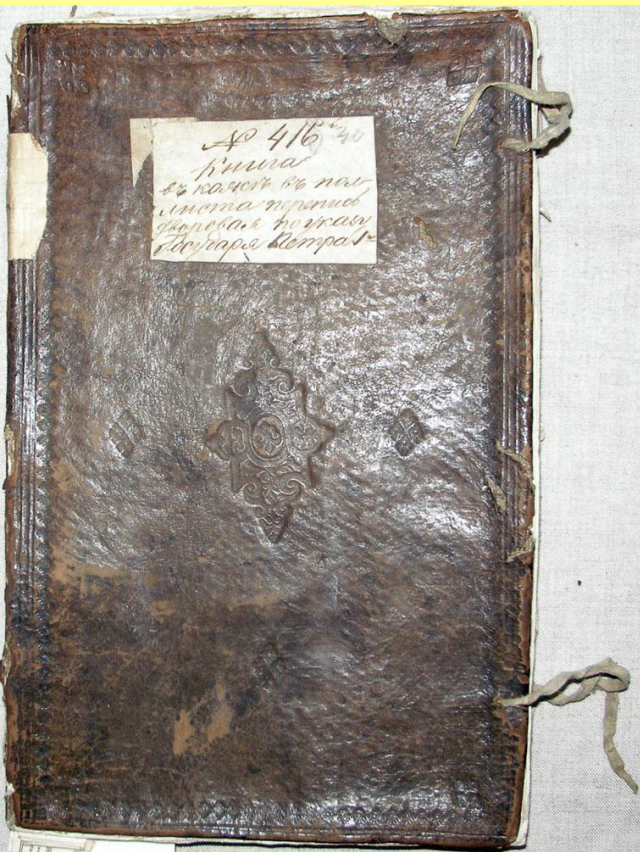
Переписная книга Антониева-Сийского монастыря. 1718 г.

В 1718 г. в России была проведена перепись населения.