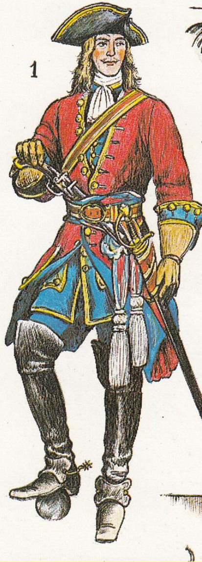
Офицер-артиллерист армии Петра I.