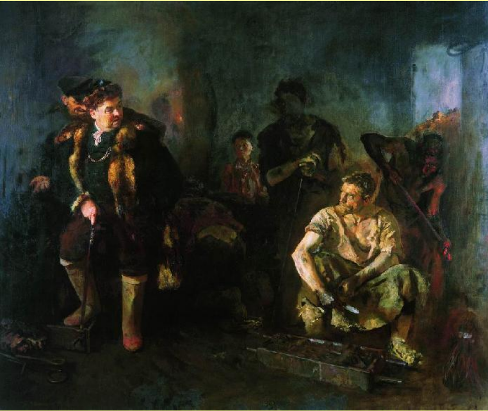
На старом уральском заводе. Худ. Б.В. Иогансон. 1937.

Среди рабочих было очень много беглых крестьян, работавших по найму.