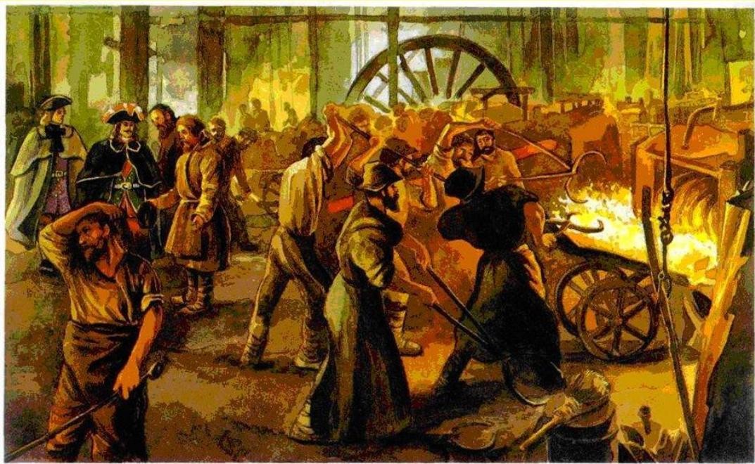
Мануфактура петровской эпохи. Современный рисунок.

К концу царствования Петра I в России имелась 221 мануфактура.