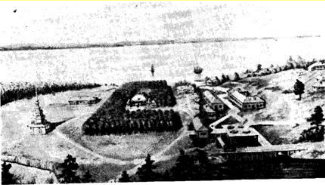
Петровский завод. С картины худ. З. Львовича.

К казенным заводам приписывали государственных крестьян для отработки тягла.