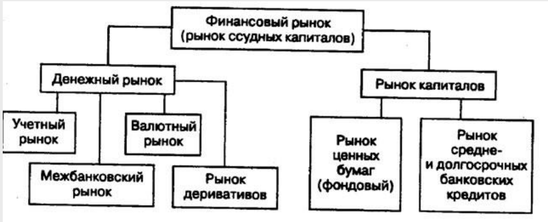
Рис.1 Структура финансового рынка