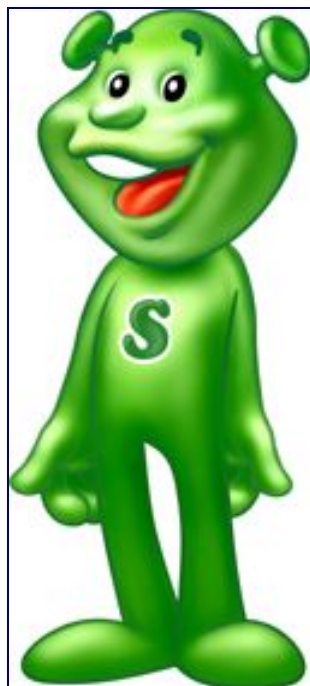
Карточка 1. Сандорик