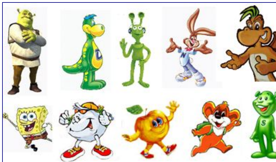
Карточка 2. Антропоморфные персонажи (каждый персонаж был помещен на отдельный лист)