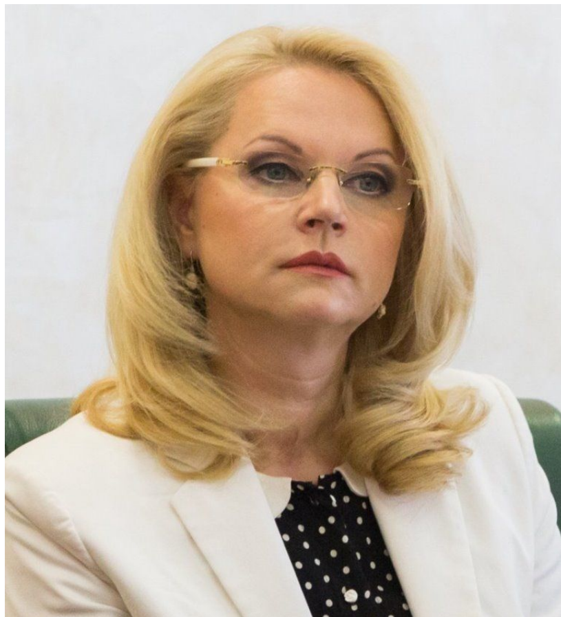
Голикова Татьяна Алексеевна