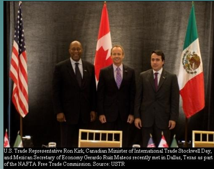
U.S. Trade Representative Ron Kirk, Canadian Minister of International Trade Stockwell Day, and Mexican Secretary of Economy Gerardo Ruiz Mateos recently met in Dallas, Texas as part of the NAFTA Free Trade Commission.