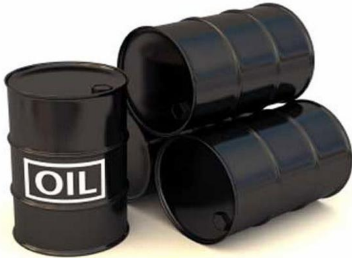
Энергетическое сырье: Нефть, газ, дизель...