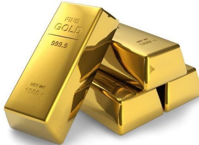
Металлы: Золото, серебро, медь...