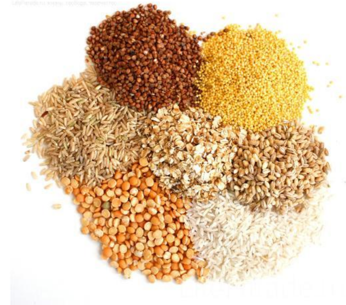
Зерновые: Пшеница, овес, ячмень...