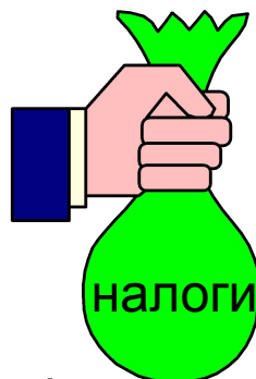
Финансово- кредитное регулирование