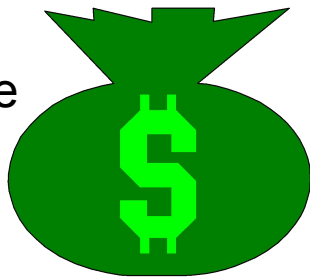
Кредитно- денежная система