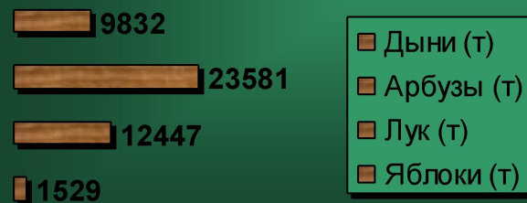
Статистика товарооборота за 2007 год