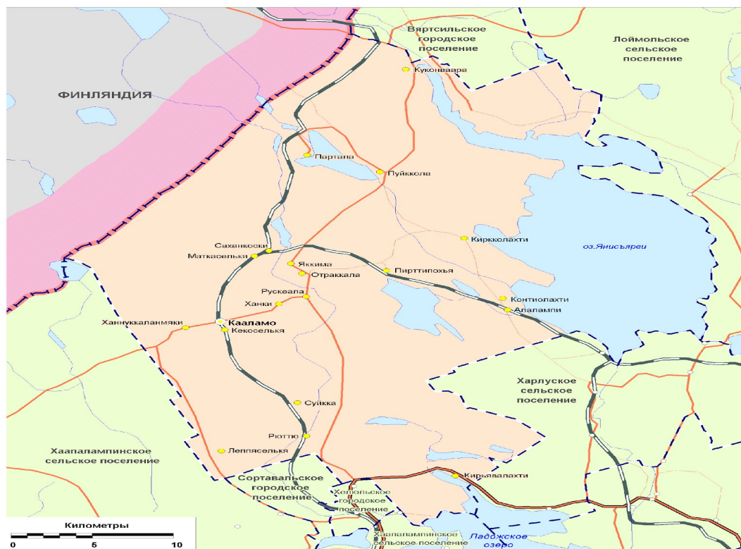
Картографическая схема установления границ Кааламского сельского поселения

Кааламское сельское поселение граничит с Сортавальским, Хелюльским, Вяртсильским городскими поселениями. Лоймольским, Хаапалампинским, Харлускогским сельскими поселениями. Финляндией.