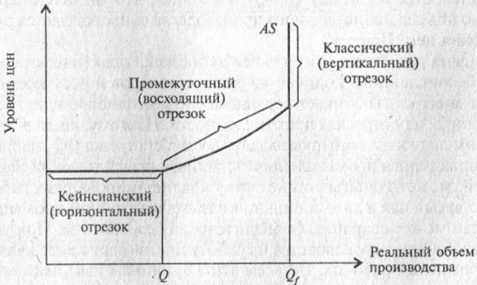
Рис. 8.3. Кривая совокупного предложения