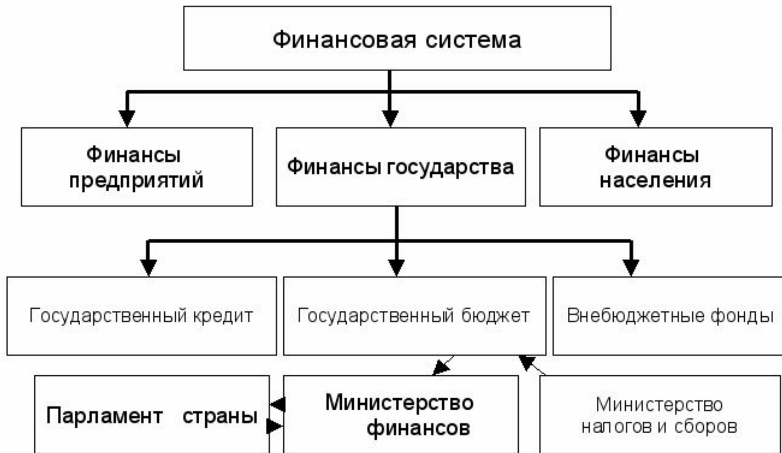
Рис. Вид современной финансовой системы страны

Основная задача государственных финансов состоит в обеспечении государства денежными средствами, которые ему необходимы для выполнения экономических функций. В их состав входят следующие звенья: государственный бюджет, внебюджетные фонды, государственный кредит