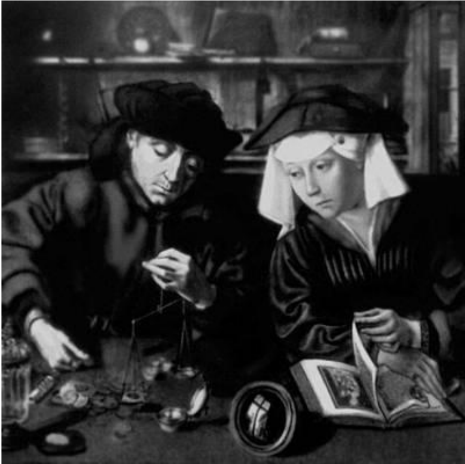
Фрагмент картины голландского живописца Квинтента Массейса «Меняла с женой» (1514 г.)

Этот фрагмент часто используют в качестве художественной иллюстрации к книгам по истории возникновения банковского дела. (Легенда)