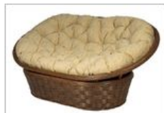
Диван Мамасан OLIMAR