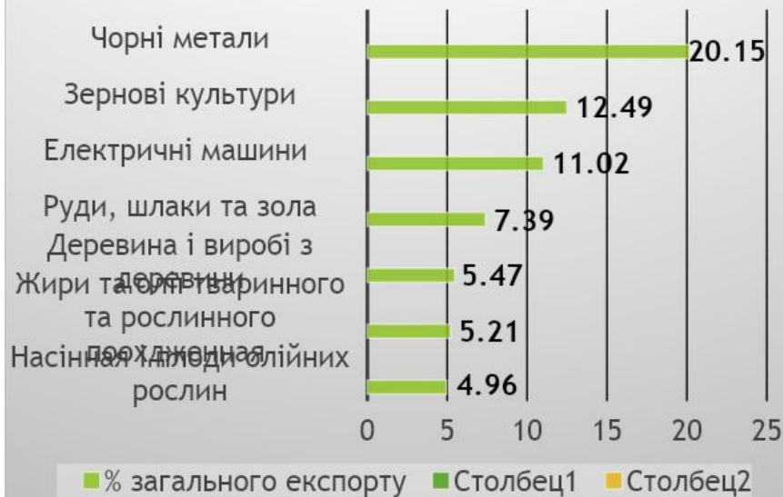
Структура експорту України в 2016 році