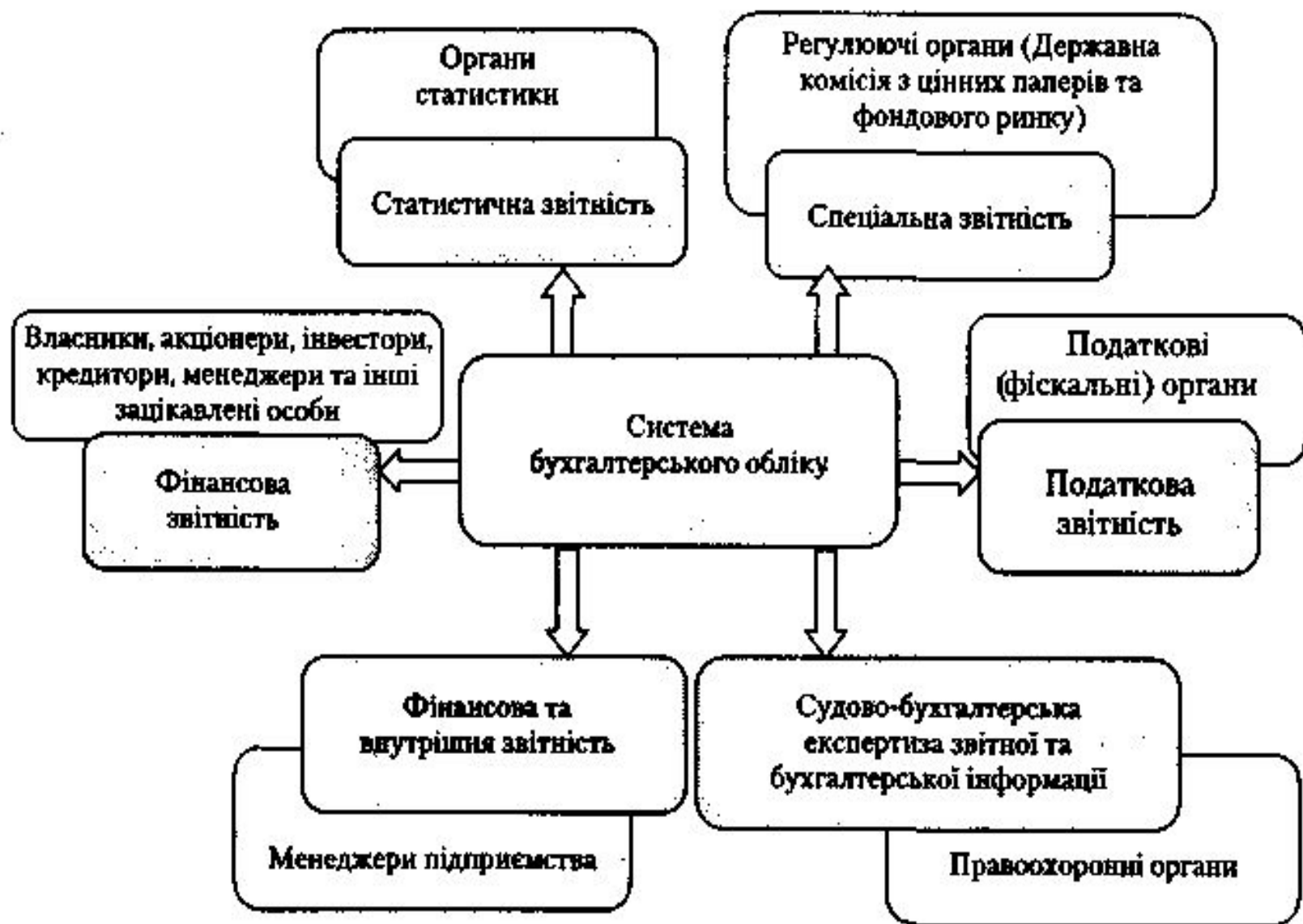
Рис. 1.2. Основні користувачі інформації, що підлягають аудиту