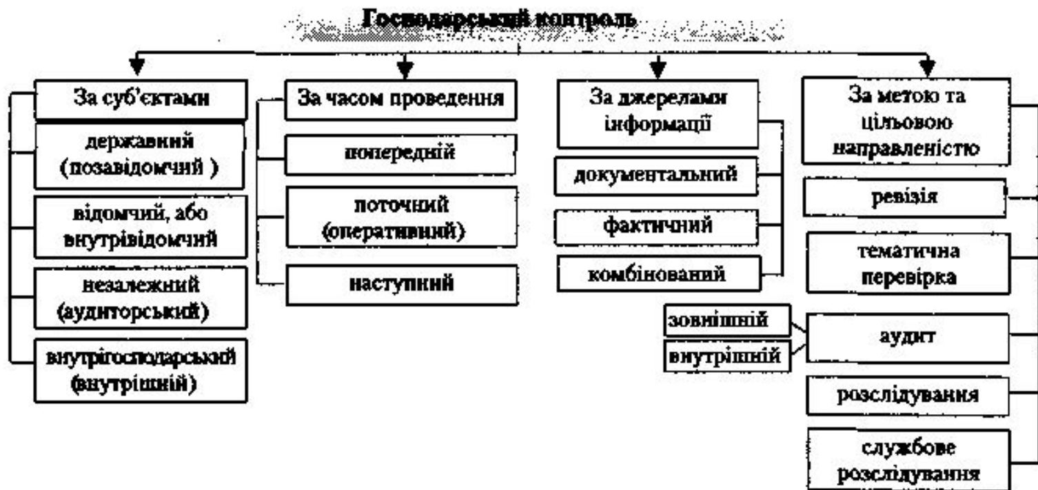
Рис. 1.1. Класифікація господарського контролю