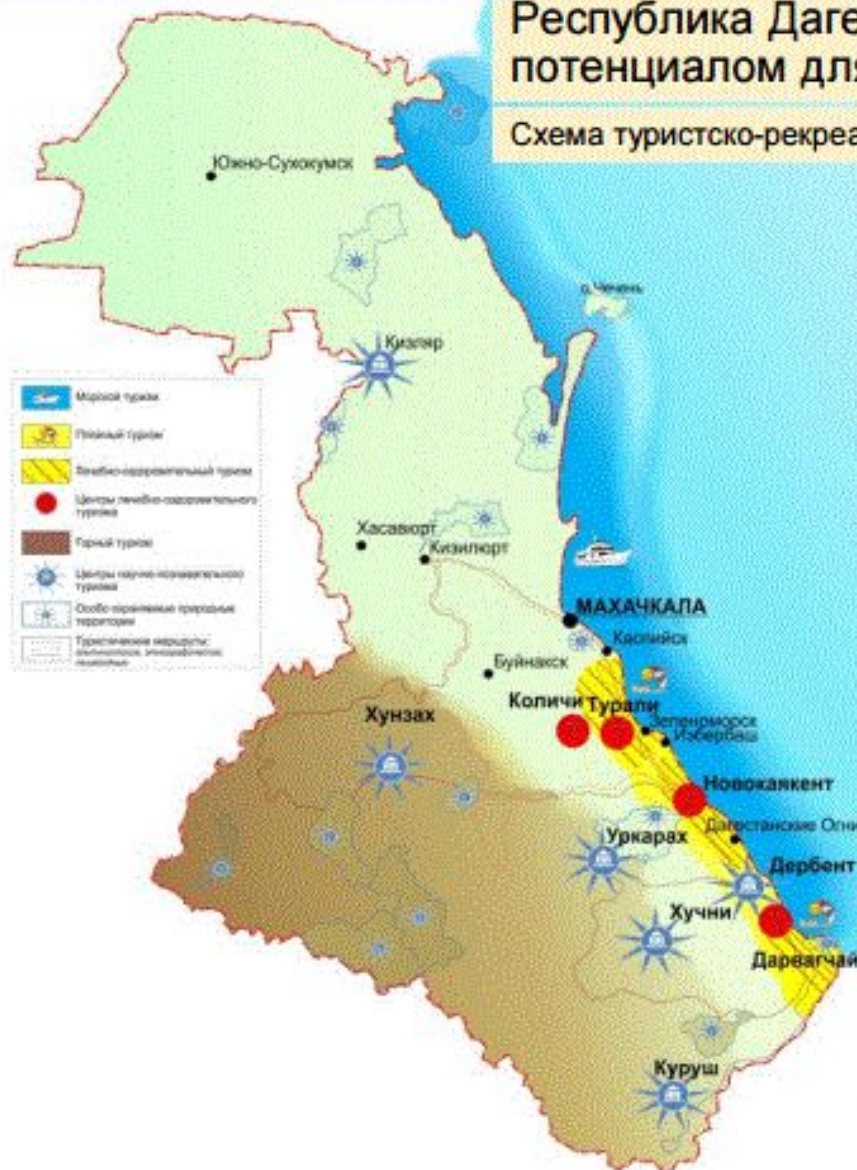
Схема туристско-рекреационного зонирования Республики Дагестан

Развитие туристско-рекреационного комплекса предполагает решение комплекса задач, затрагивающих как структурные преобразования, так и системные процессы в туристско-рекреационной сфере: