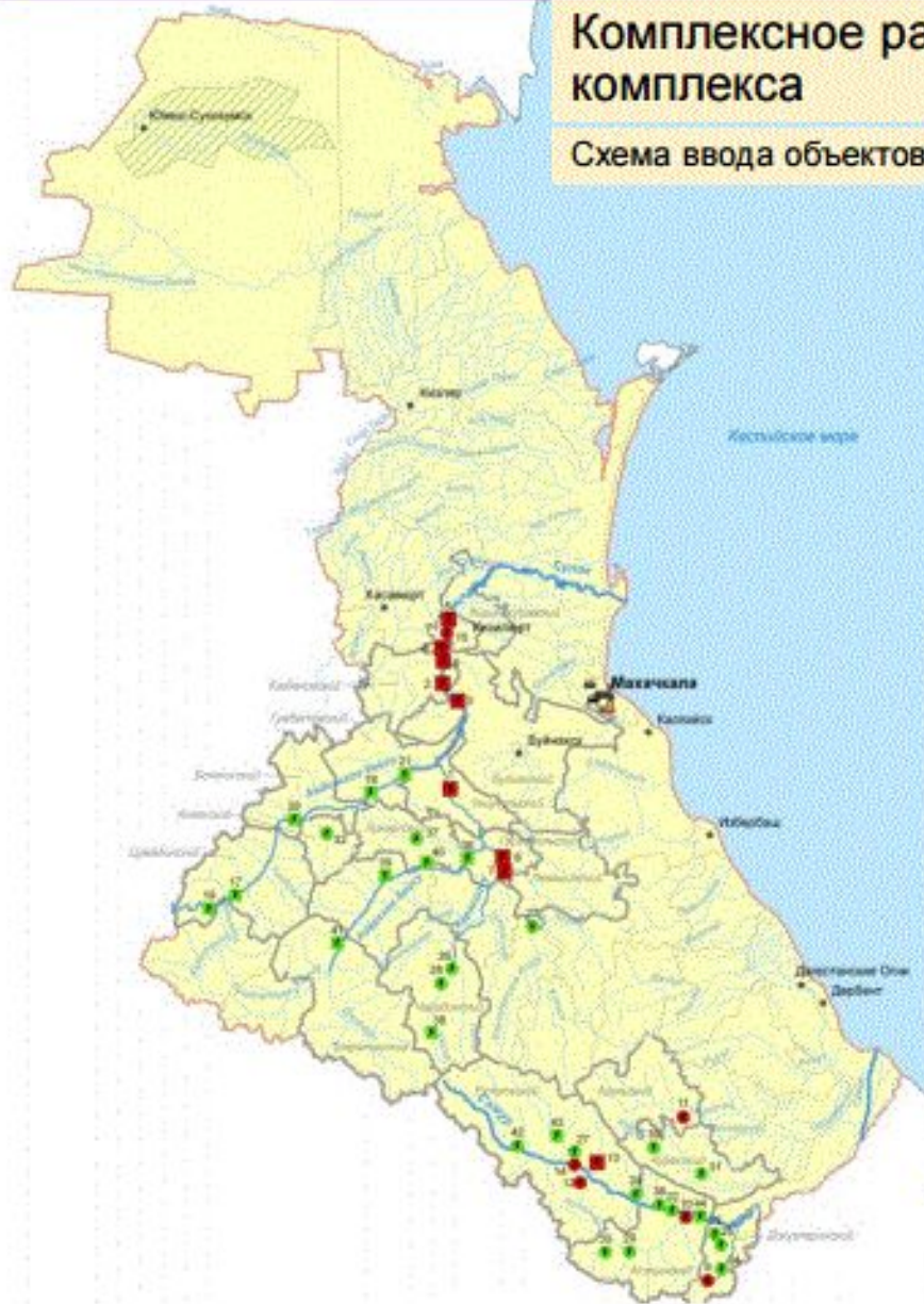
Схема ввода объектов топливно-энергетического комплекса