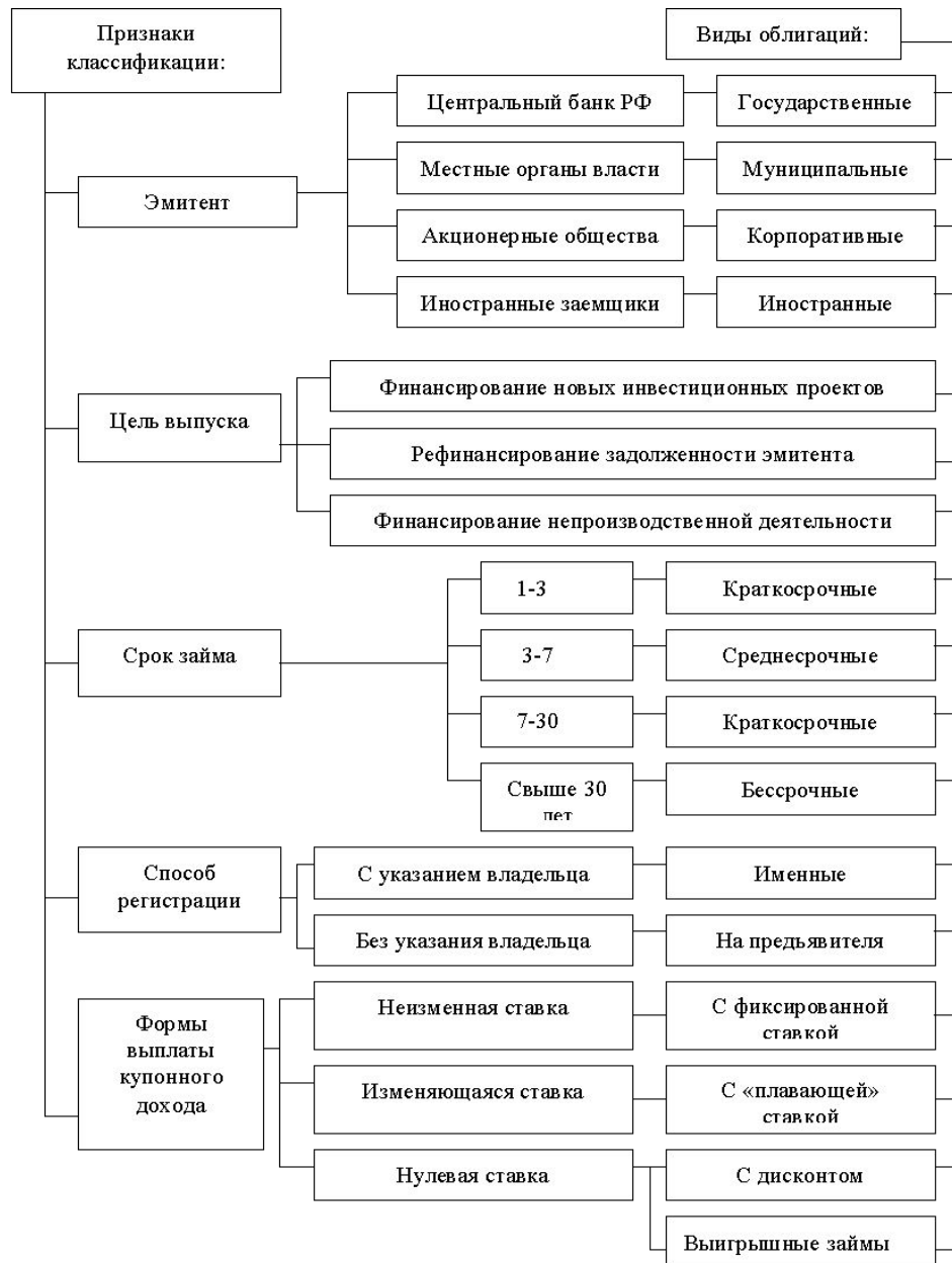
Рис. 1.3 общая схема классификации облигаций