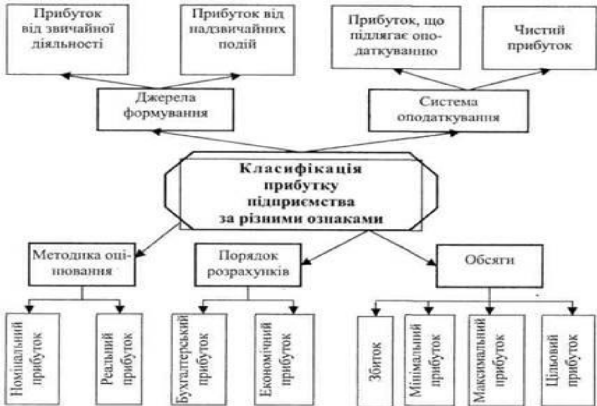
Рис. 11.1. Види прибутку підприємства