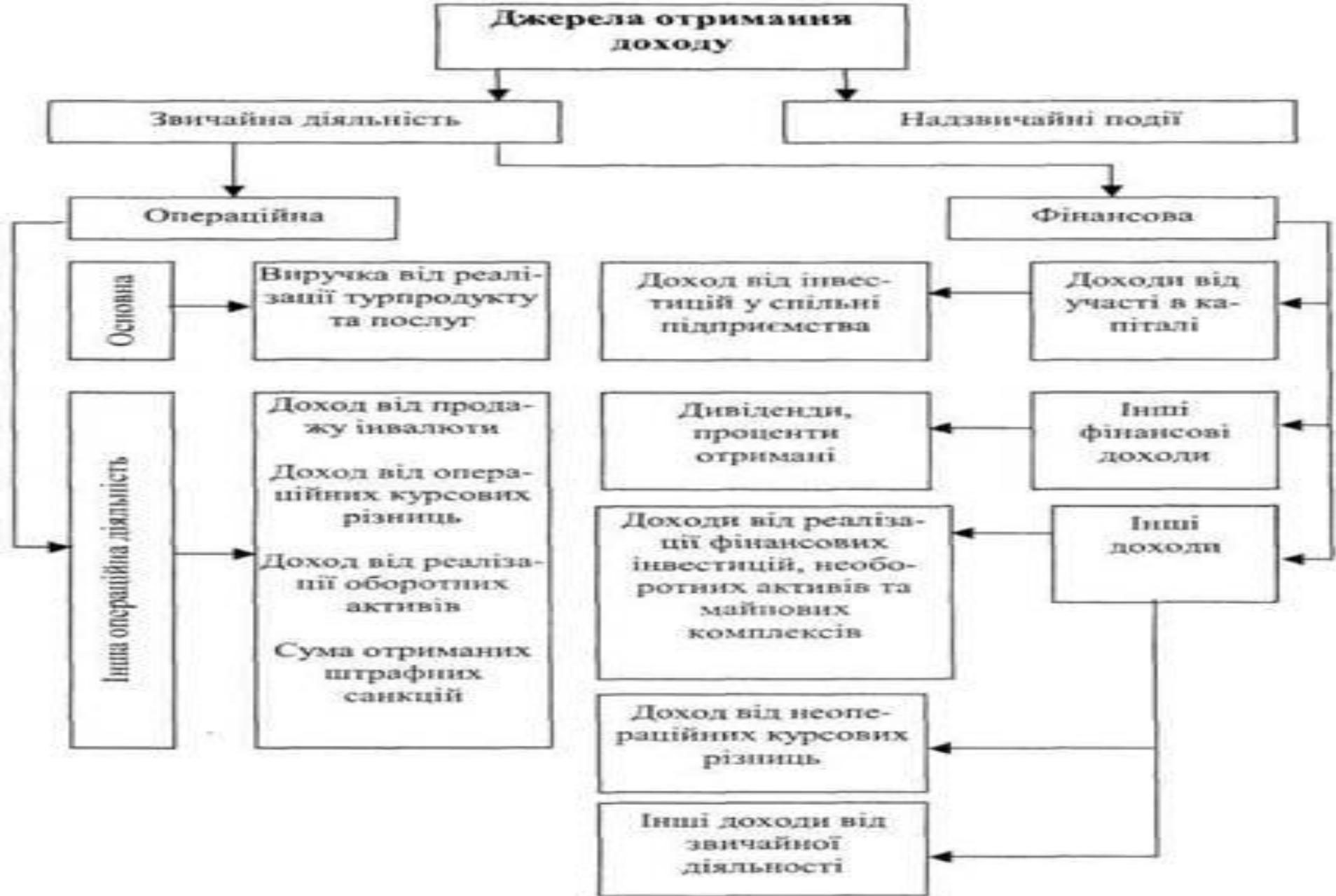
Рис. 9.2. Схема формування доходу відповідно до стандартів бухгалтерського обліку