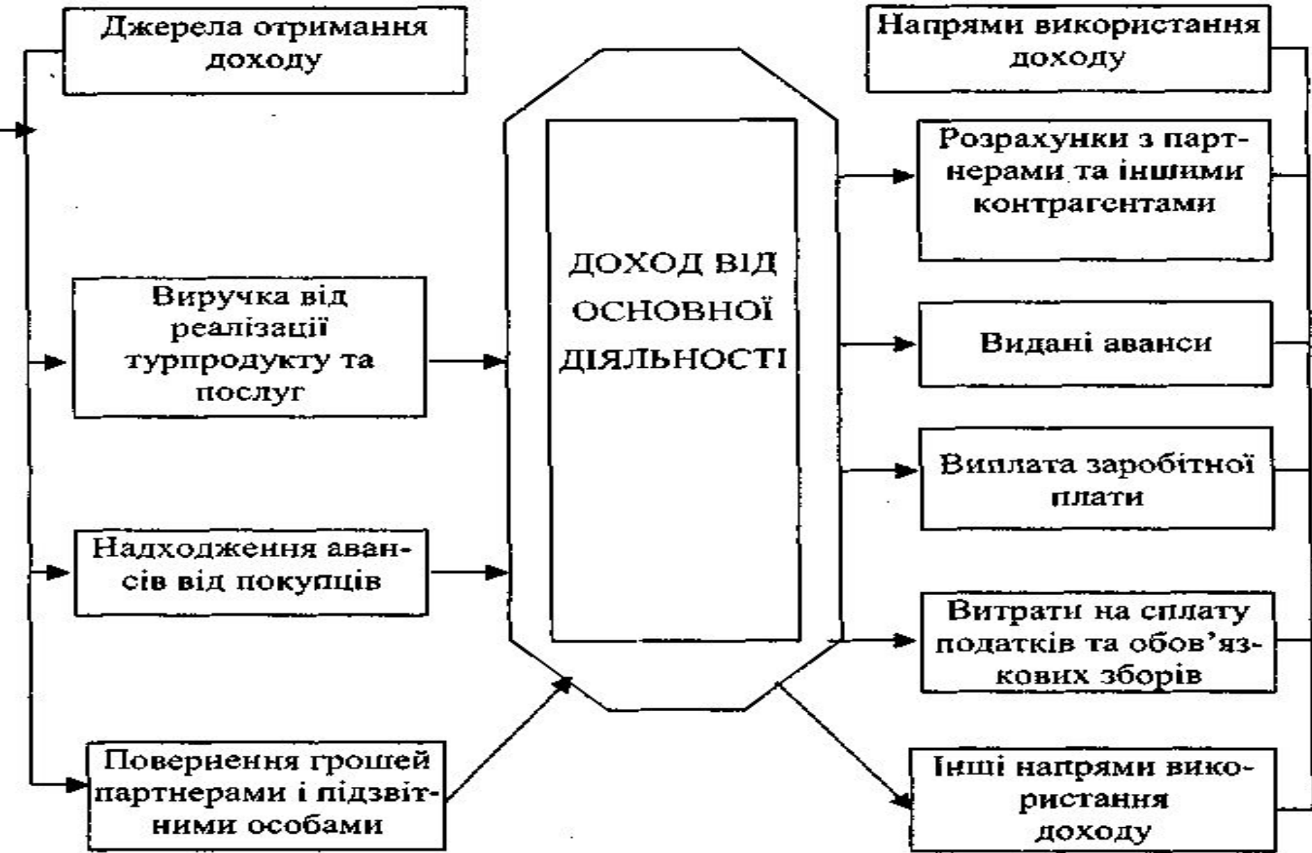
Рис. 9.3. Джерела формування і напрями використання доходу від основної діяльності туроператора