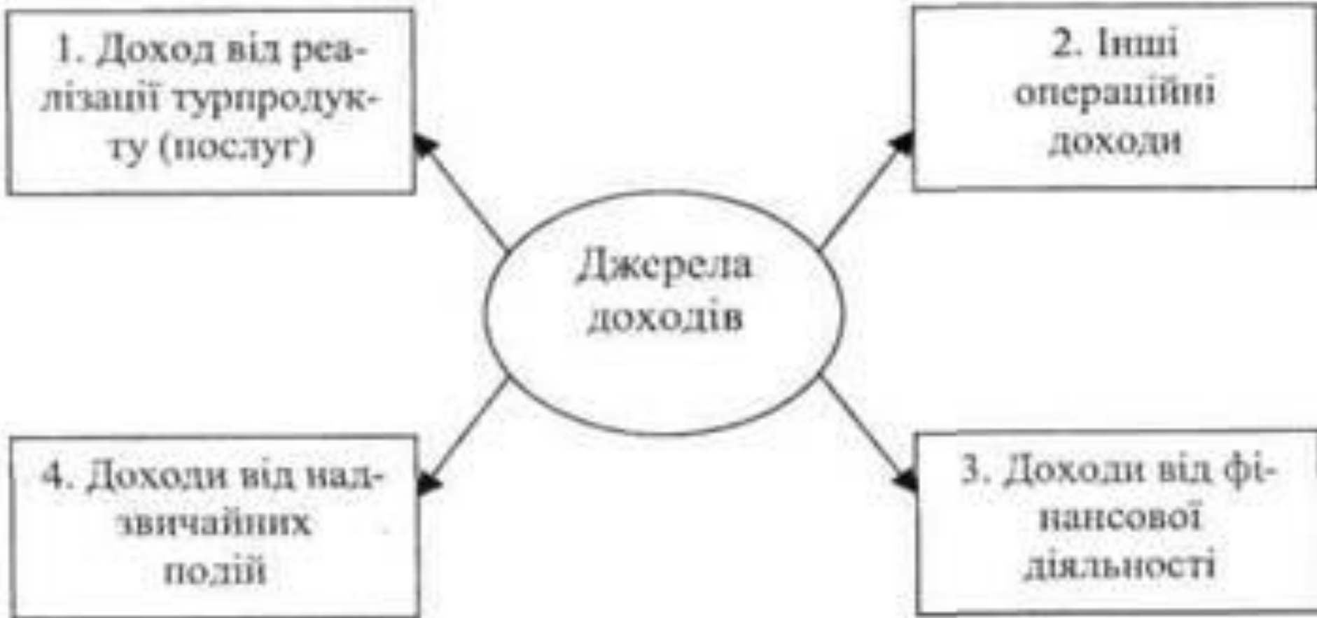
Рис. 9.5. Основні джерела формування доходу туристичного підприємства