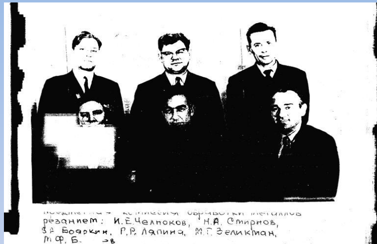
Цикловая комиссия обработки металлов

По свидетельству современников, они зарекомендовали себя высококвалифицированными специалистами.