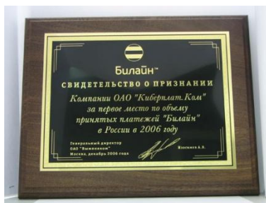
«Билайн»: первое место про объему принятых платежей» за 2006 г.

В декабре 2006 г. преодолен порог 3 млн. платежей в день.