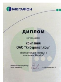
Диплом «Мегафон» за самый большой вклад в «копилку», 2005 г.