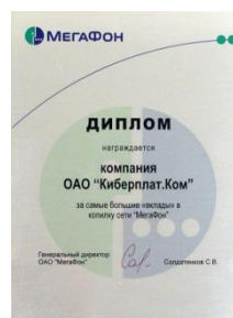
Диплом «Мегафон» за самый большой вклад в «копилку», 2005 г.