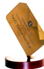
Диплом МТС: первое место по объему принятых платежей, 2006 г.