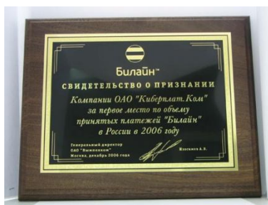
«Билайн»: первое место про объему принятых платежей» за 2006 г.

В декабре 2006 г. преодолен порог 3 млн. платежей в день.