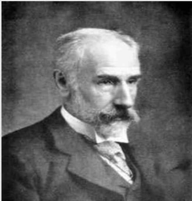
Френсис Исидор Эджуорт