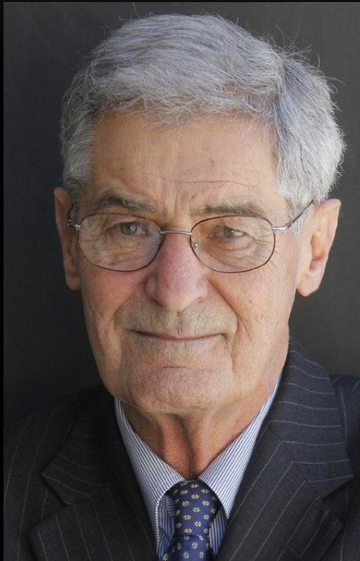
Роберт Лукас (15 сентября 1937г) Американский экономист