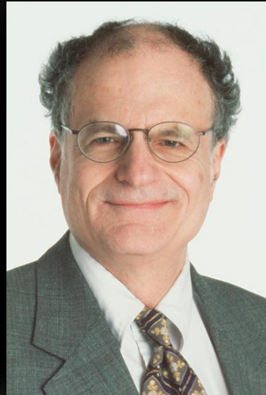
Томас Сарджент (19 июля 1943г.) Американский экономист