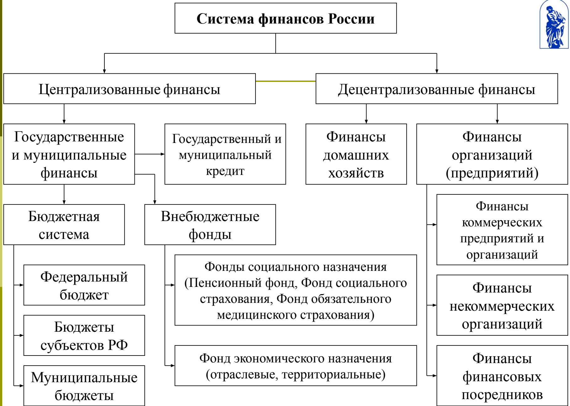
Рисунок – система финансов России