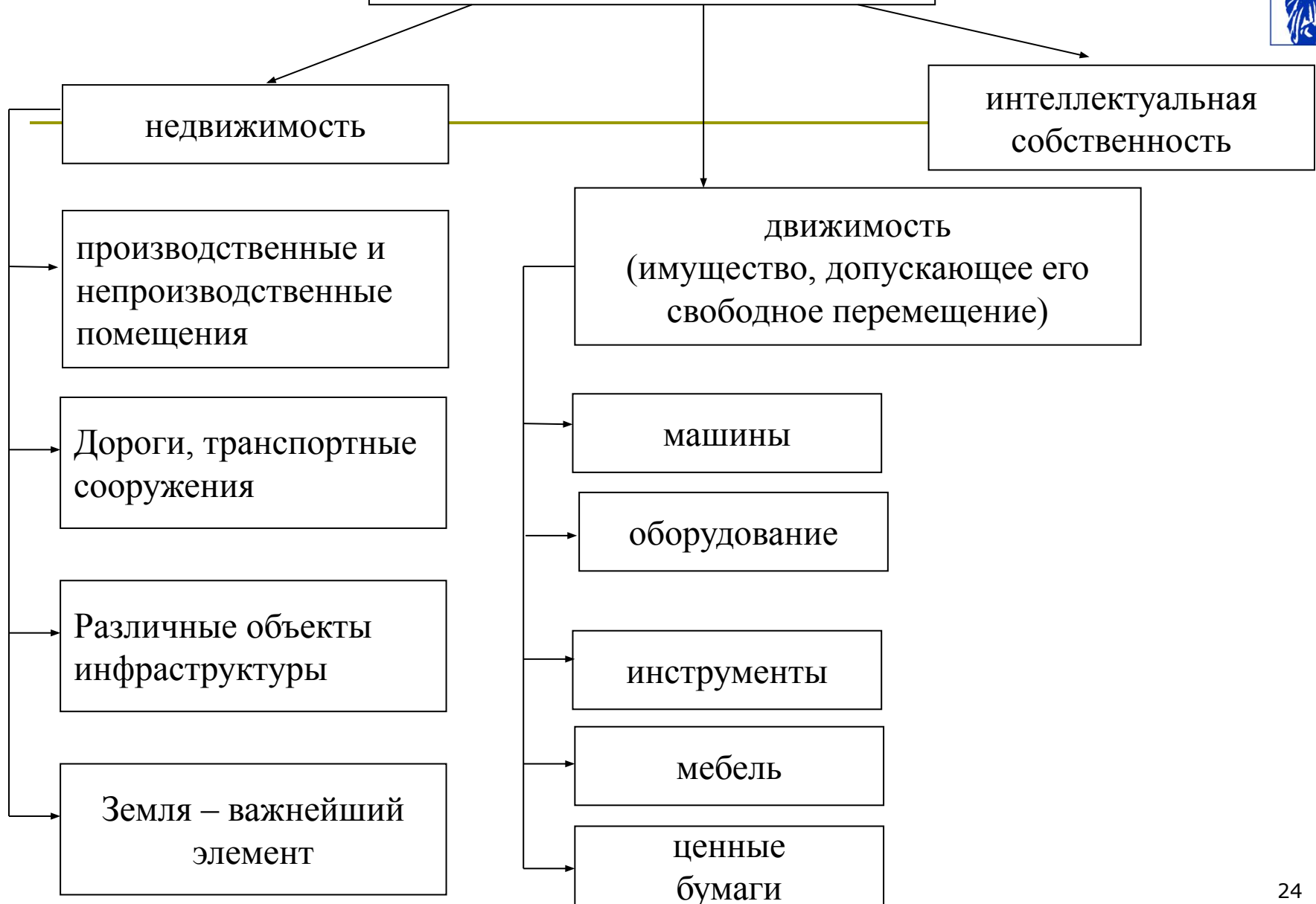
Рисунок – классификация объектов собственности