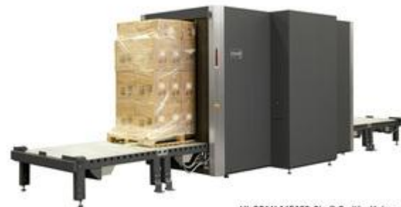
HI-SCAN 145180-2is © Smiths Heimann