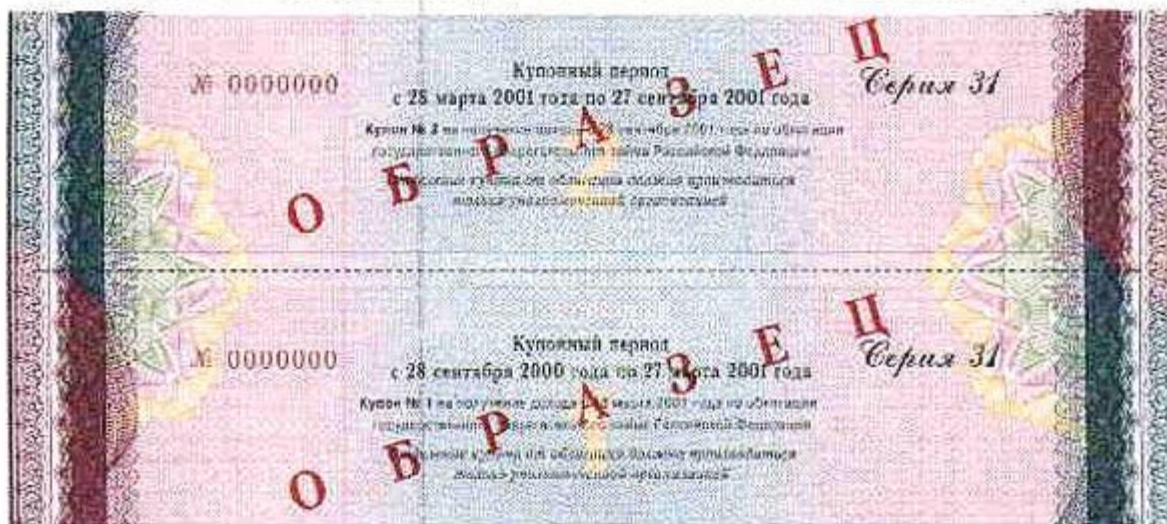
Пример облигации России (2001 г.)